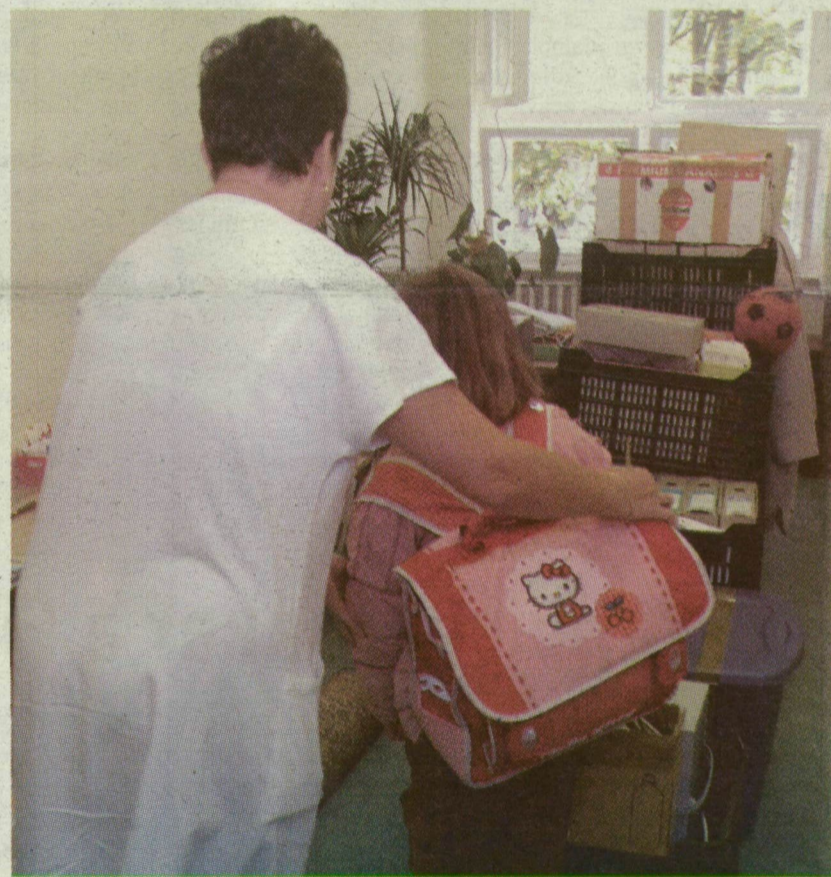
A GYERMEKPSZICHIÁTRIA A VOLT SPORTORVOSIBAN MŰKÖDIK MAJD