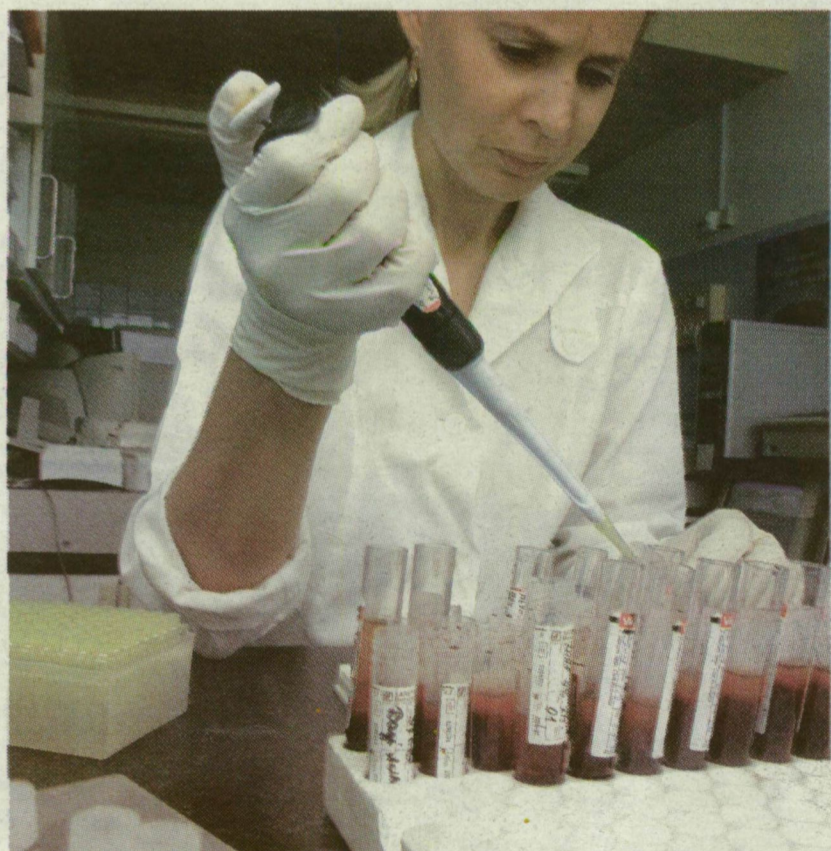
■ VIZSGÁLAT AZ ÁNTSZ JÁRVÁNYÜGYI LABORJÁBAN. MÉG NEM TUDNI, HANTAVÍRUS ŐLTE-E MEG A NÉMET MEDIKUST

egy iskolabokorba. Hogy pontosan hányba, azt ma még nem lehet tudni, vannak tervek kettőre, háromra és négyre is.