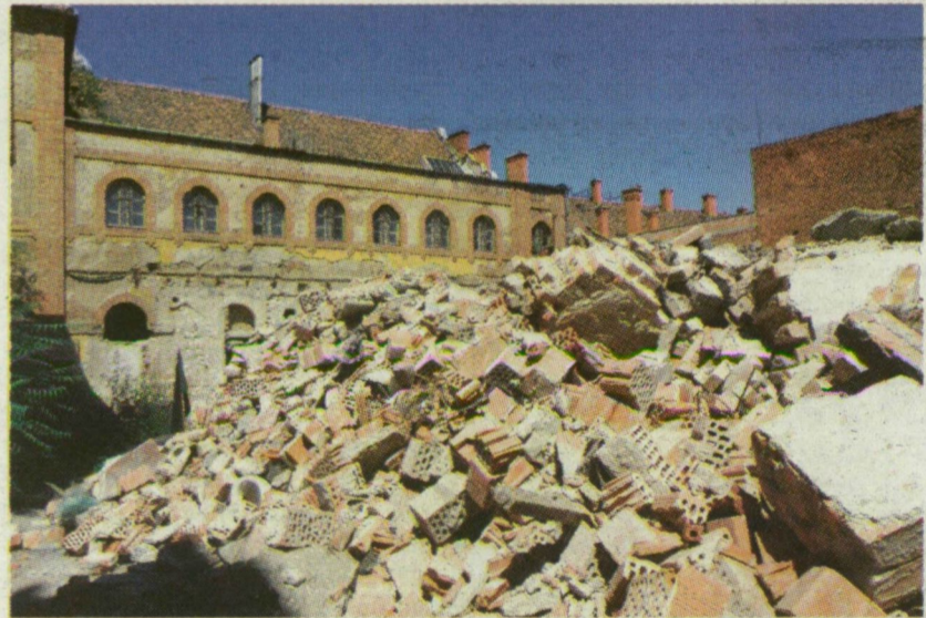
PETŐFI SZÁLLÓ, SZENTES, 2008. ÖTCSILLAGOS HOTEL LESZ BELŐLE?

Ha nem bízna a forgalomban, nem fogott volna a felújításhoz – ezt mondja az a fővárosi befektető, aki a szentesi Petőfi Szállóból a régió első ötcsillagos szállodáját építi. A szegedi Forrás igazgatója szerint viszont még a megyeszékhelyen sincs kereslet ilyen luxushotelre.