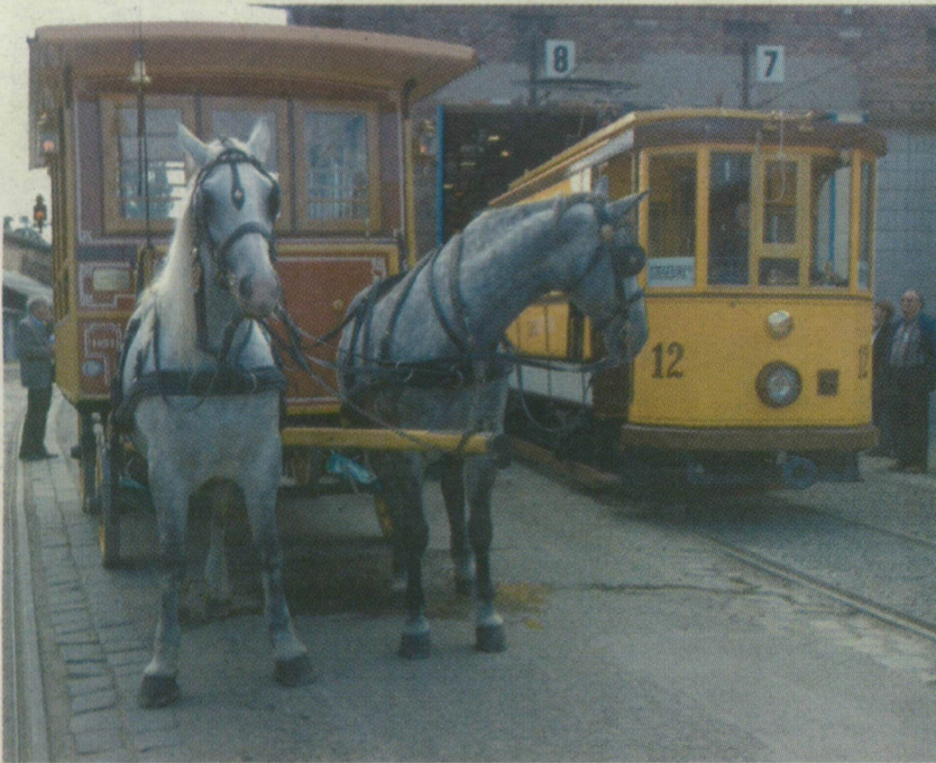
■ A „LŐERŐ” IS RÁCSODÁLKOZOTT A SZÁZÉVES JÁRGÁNYRA