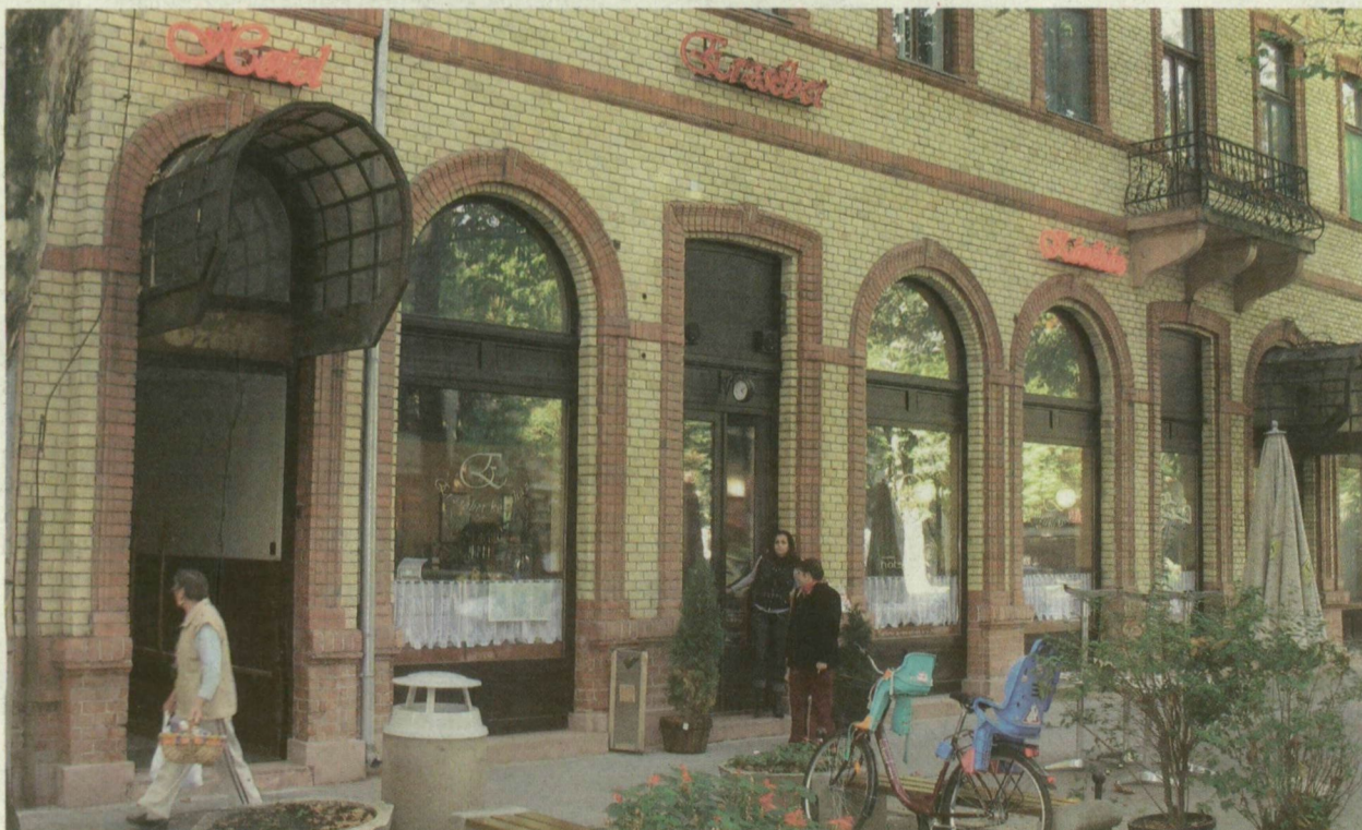
■ A SZÁLLÓ ÉVEK ÓTA MILLIÓS MÍNUSZT TERMEL

a legkorszerűbb technikai megoldásokról. Az együttműködési megállapodást várhatóan októberben írja alá a vállalat és a kar, amely már évek óta áll szakmai kapcsolatban a szakterületén vezetőnek számító svéd SKF szegedi képviselőjével.