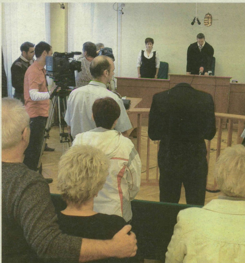
■ F. ROLAND LEHAJTOTT FEJVEL HALLGATTA AZ ÍTÉLETET

A tárgyaláson megjelent az áldozat édesanyja és édesapja, valamint a vádlott édesanyja és nevelőapja. Mindketten könnyezve köszöntek el a fiuktól. → Folytatás a 3. oldalon