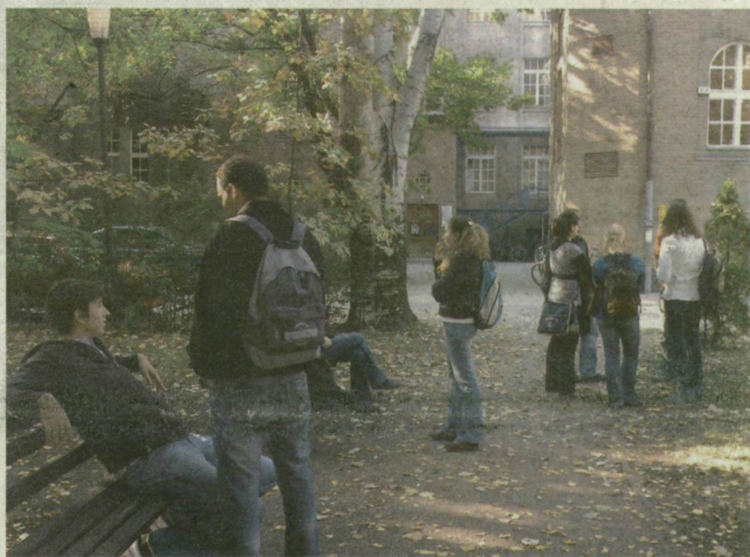
■ EGYETEMISTÁK A KÜLFÖLDI HALLGATÓK OKTATÁSI KÖZPONTJA ELŐTT; A NÉMET FIÚ HALÁLÁRÓL SOK A SZÓBESZÉD KÖZÖTTÜK