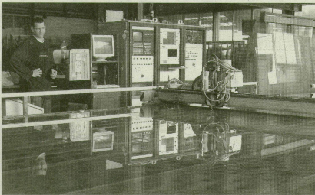
A legmodernebb gépsorokon szabják az óriási üvegtáblákat