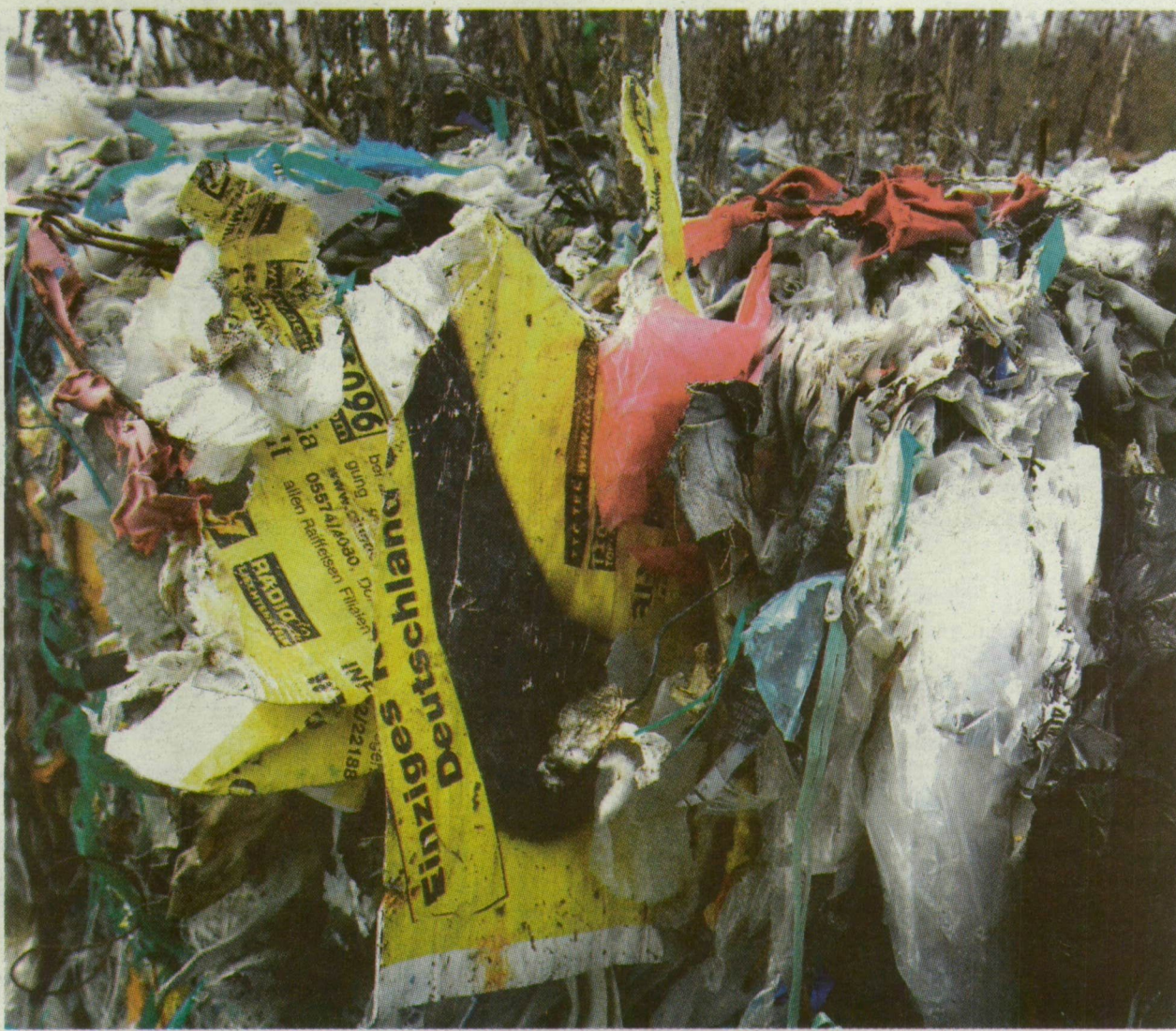
A HULLADÉK ELSZÁLLÍTÁSÁRÓL, ANNAK IDŐPONTJÁRÓL MÉG MINDIG NEM TÁJÉKOZTATTÁK AZ ÉRINTETTEKET