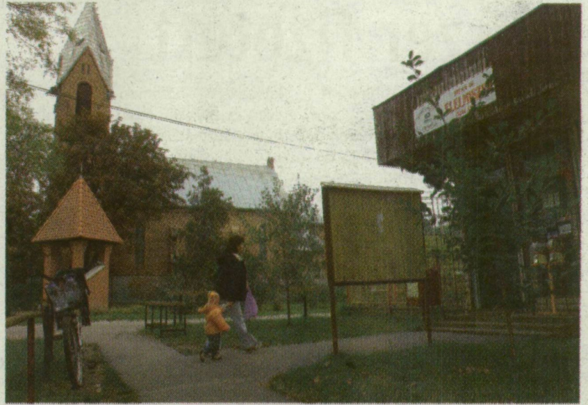
KÖVEGY NEVEZETESSÉGE AZ 1902-BEN ÉPÜLT TEMPLOM

Kövegyről ugyanakkor nemcsak azt lehet tudni, hogy a legkisebb, de azt is, hogy Magyarcsanak után a megye második legszegényebb települése. A munkanélküliség 17 százalékos - aki dolgozik, többnyire Makóra vagy Palotára jár át. Miért jó mégis Kövegyen lakni? Például azért, mert itt tényleg mindenki ismer mindenkit, a hangulat családi, és a bűnözés is jószerevével ismeretlen fogalom. S persze azért is, mert az aprócska falu vezetése - lehetőségeihez mérten - igyekszik a települést széppé, otthonossá tenni. Nemrég újították fel például pályázati támoga-