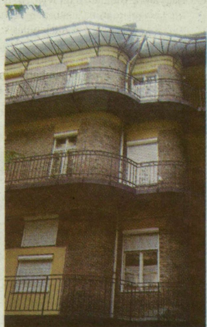
■ ÚJONNAN ÉPÜLT SZOCIÁLIS BÉRLAKÁSOK AZ ARANY JÁNOS UTCÁBAN

Ennyi pénzért jó állapotú albérletet nem lehet találni a városban, és ismeretlen az a konstrukció is, amelynek értelmében ma csak úgy bemehetnének a „városhoz”, és holnapról már bérlő is vehetnének egy üres, kifestett, jó karban lévő önkormányzati la-