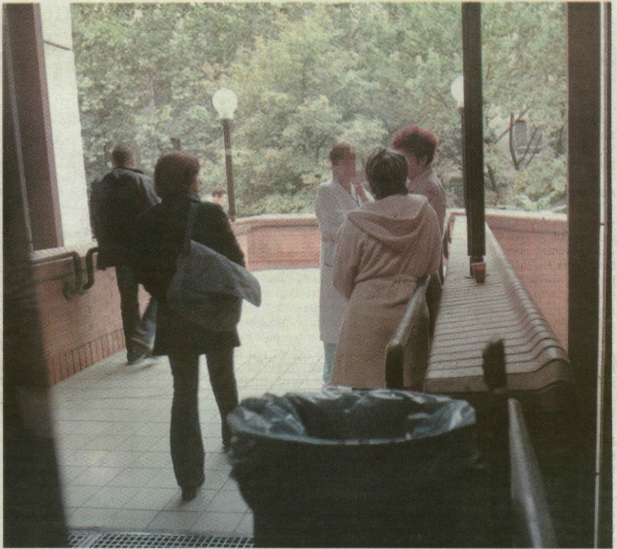
A SZEGEDI ÚJ KLINIKA BEJÁRATÁNÁL GYÚJTHATNAK RÁ A BETEGEK ÉS A LÁTOGATÓK