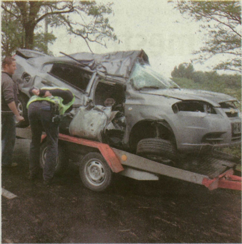
■ ENNYI MARADT A CHEVROLET-BŐL. NEM CSODA, HOGY A FIATAL HÁZASPÁR NEM ÉLTE TÚL A BALESetet