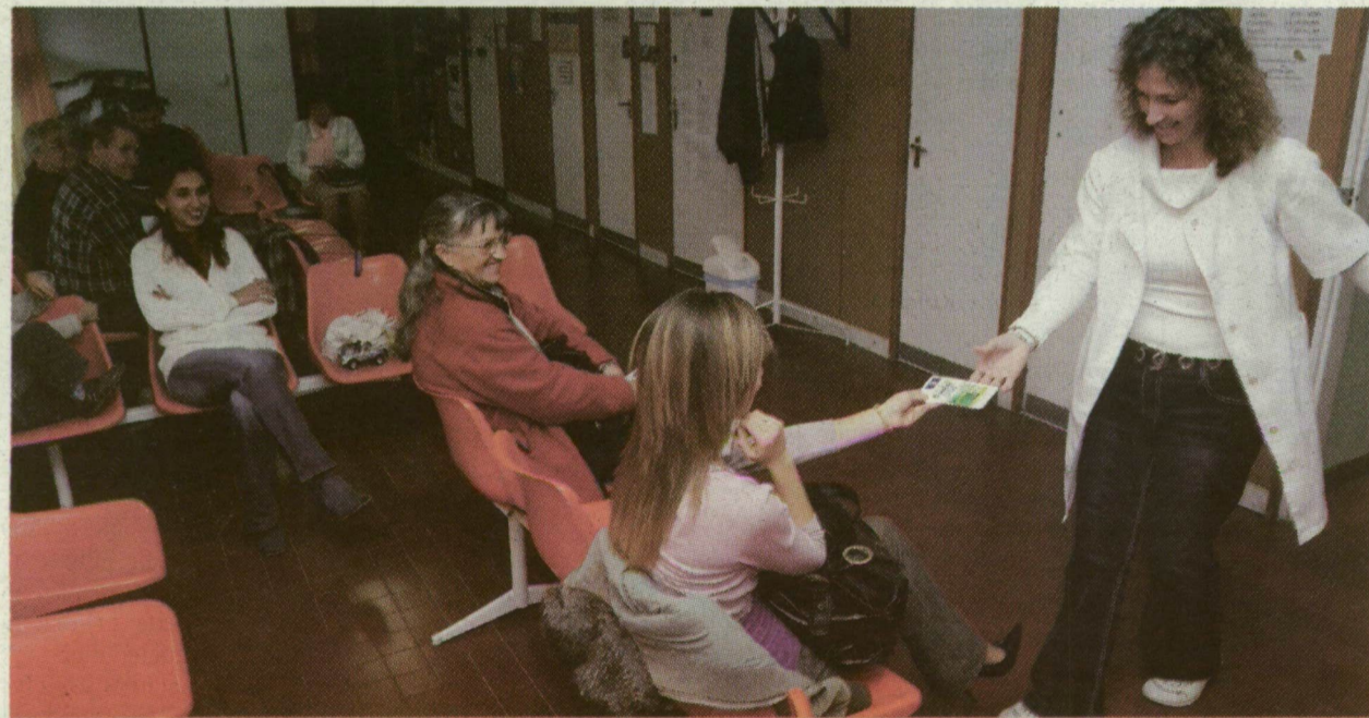
RIKITA FOTÓ SZEPTEMBERBEN: TELE VAN A VÁRÓ A DEBRECENI UTCAI RENDELŐBEN