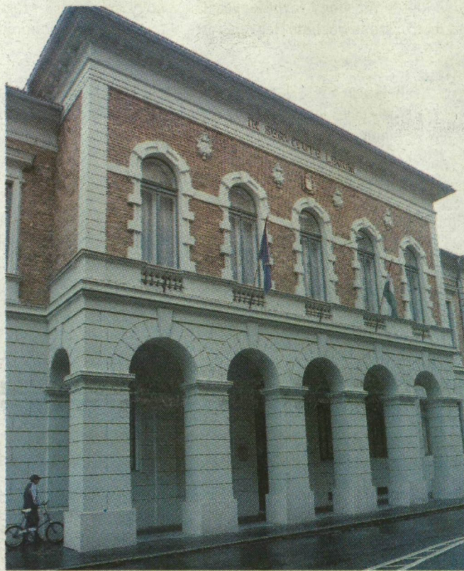
■ EGY FELJÚTÁS ALATT ÁLLÓ ÉS EGY CSILLOGÓ-VILLOGÓ IGAZSÁGÜGYI ÉPÜLET: AZ EGYKORI SAJTÓHÁZBA A CSONGRÁD MEGYEI FŐÜGYÉSZSÉG ÉS A NYOMOZÓÜGYÉSZSÉG KÖLTÖZIK MAJD, A VALAMIKORI JUHÁSZ GYULA MŰVELŐDÉSI KÖZPONTBAN VISZONT MÁR DOLGOZNAK A FELLEBBVITELI FŐÜGYÉSZSÉG MUNKATÁRSAI