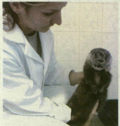
■ AZ ÁLLATOKTÓL VÉRT ÉS VIZELETET IS VESZNEK