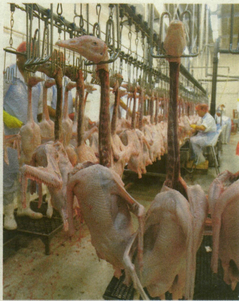
A SZENTESI HUNGERITNÉL MÁR CSAK A HÍZOTT LIBÁKAT DOLGOZZÁK FEL

további FOTÓK a témáról az interneten! www.delmagyar.hu