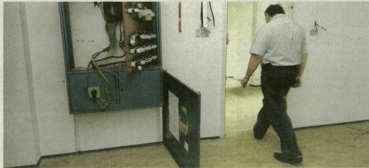
AZ ÚJ GAZDÁNAK SOKBA KERÜL, MIRE RENDBE HOZZA AZ ÉPÜLETET

→ KÍSÉRTETHÁZ. Az épület 2003 végén vált lakatlanná, miután ingyenes használója, a Dél-Alföldi Népművészeti Egyesület tízmillió közüzemi számlája miatt a vizet és az áramot kikapcsolták – a tulajdonos önkormányzat pedig kiköltöztette őket. 2005-ben már hajléktalanok laktak benne, felverte a gaz, egyesek pedig személteláronak használták. Mivel az épület felújítása túl drága lett volna, a város többször próbálta eladni – eddig sikertelenül.