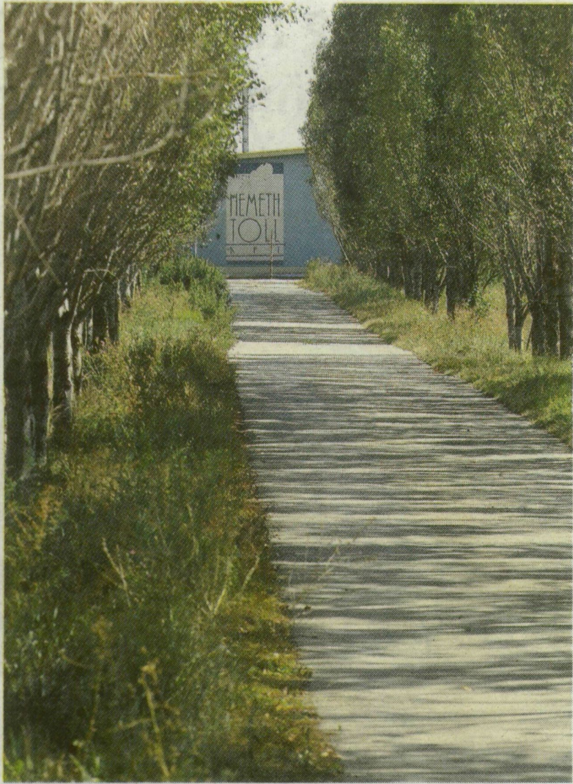
■ A NÉMETH TOLL KFT. BEJÁRATA KLÁRAFALVÁNÁL. TITOK, MI ZAJLIK A SZÁRADÓ NYÁRFASORRAL SZEGÉLYEZETT ÚT VÉGÉN

Letartóztatásáig a térség gazdasági és közéletének egyik ismert szereplője volt. Elnökévé választotta a Marosmenti Vállalkozók Szövetsége. A Németh Toll támogatta a makói női kézilabdacsapatot, az elsők között építke-