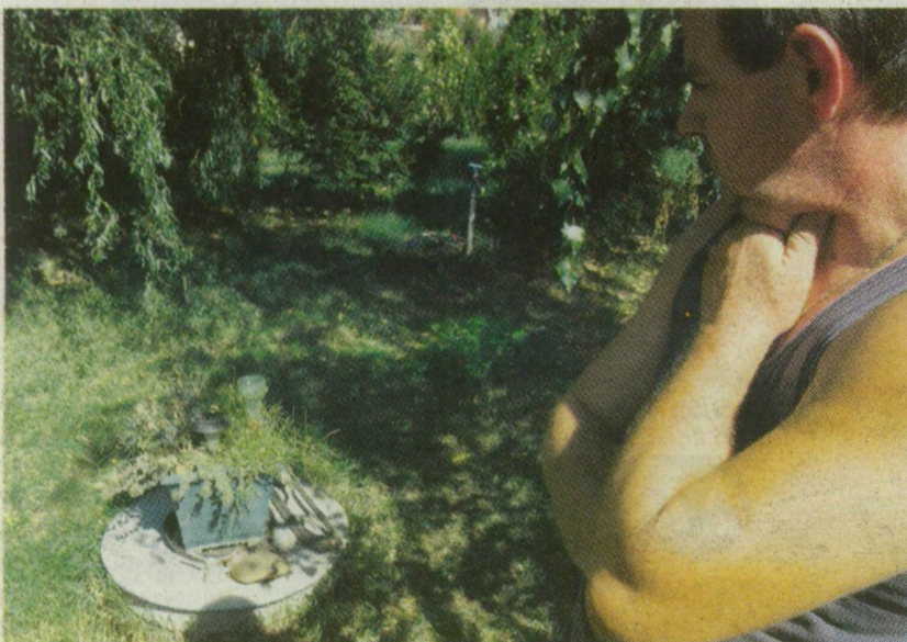
■ A CSATORNA SZIVATTYÚHÁZA A KLÁRAFALVI BALOGHÉK PORTÁJÁN. EZ A RENDSZER KÖTI A TELEPÜLÉST A NÉMETH TOLL KFT. SZENNYVÍZTISZTÍTÓJÁHOZ