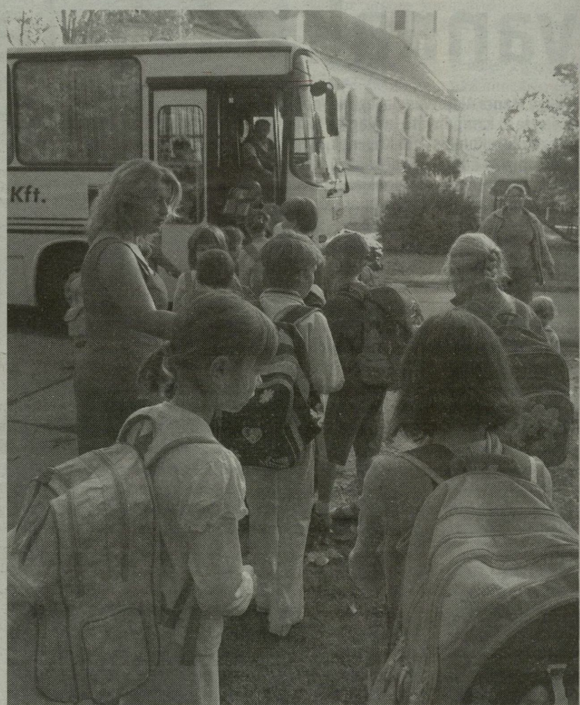
INDULNAK A KÜBEKI ALSÓSOK A SZŐREGI ISKOLÁBA. MINTHA MINDEN REGGEL OSZTÁLYKIRÁNDULÁSRA MENNÉNEK

további FOTÓK a témáról az interneten! www.delmagyar.hu