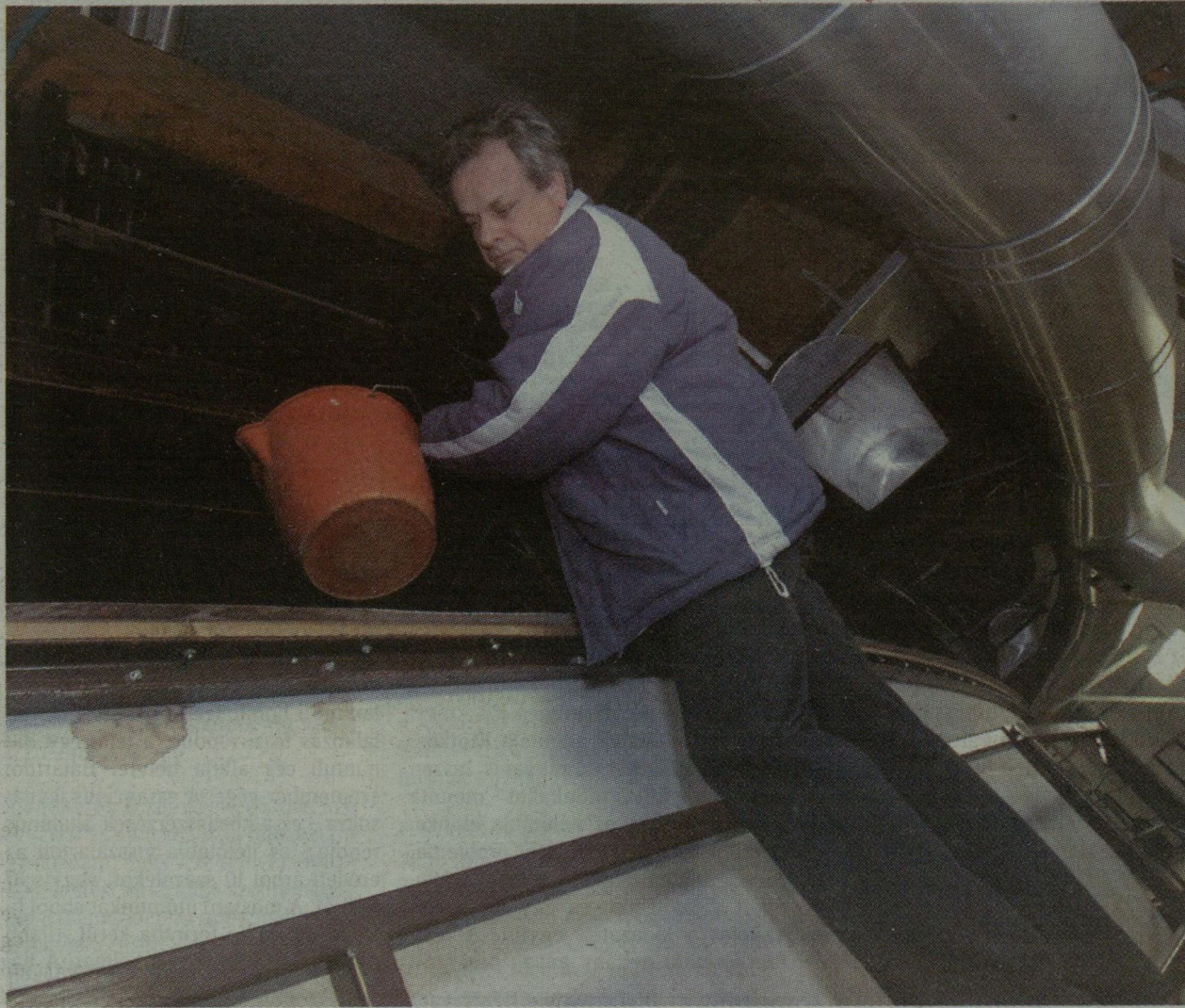
A HÁZ OLYAN MŰSZAKI ÁLLAPOTBAN VAN, HOGY AZONNAL KEZDENI KELL VELE VALAMIT