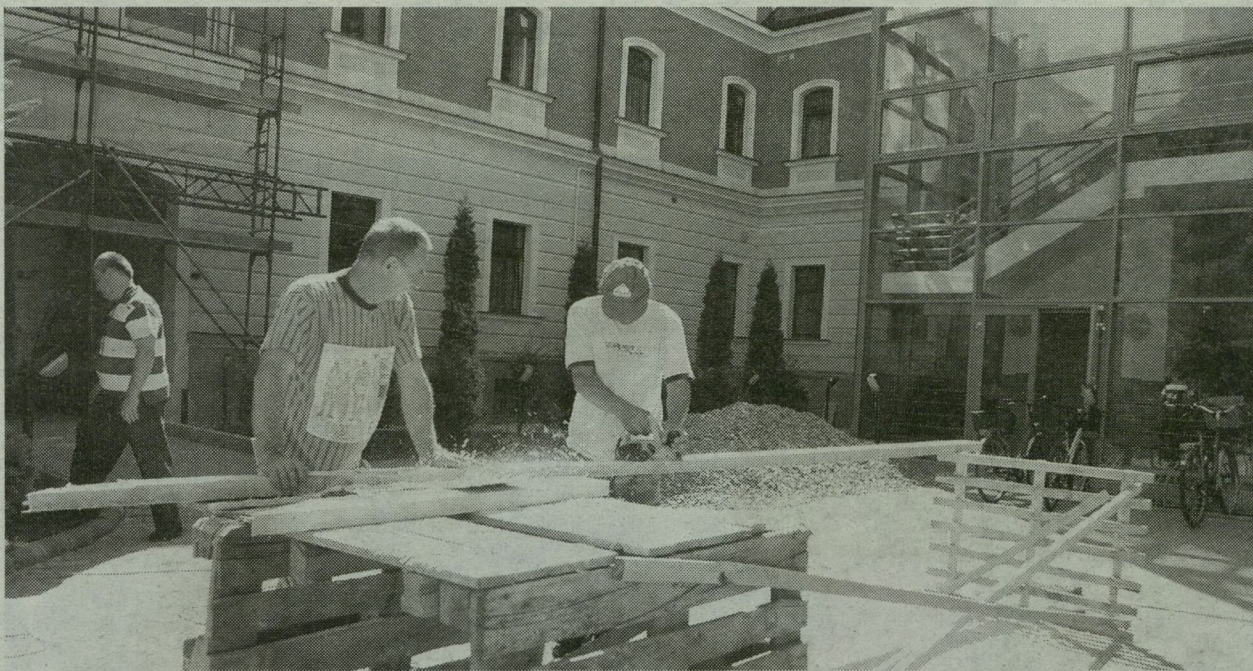
ÁZTAK A FALAK, BEROGYOTT A TETŐ, FELTÖRT A SZENNYVÍZ, SZÉTFAGYOTT A HOMLOKZAT ÉS A LÁBAZAT