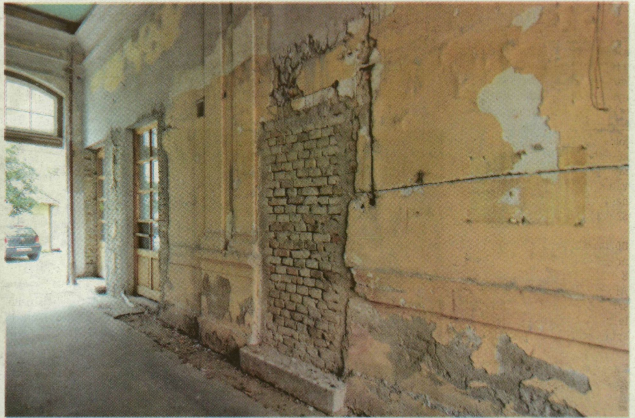
■ ENNEK A BELVÁROSI HÁZNAK IS GUSZTA A KÜLSŐ CSOMAGOLÁSA