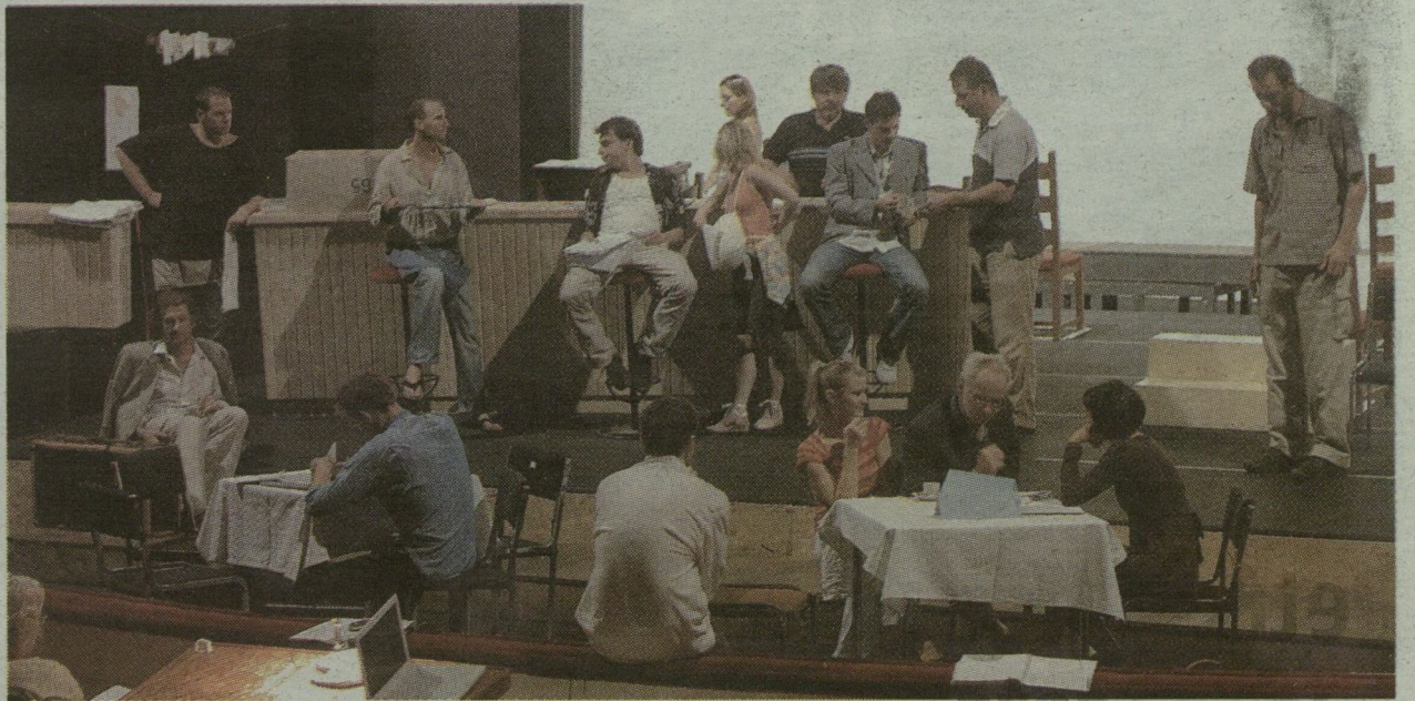
A RÉGI ÉS AZ ÚJ TAGOK EGYÜTT PRÓBÁLJÁK AZ ÉVAD ELSŐ PRODUKCIÓJÁT, A KÁVÉHÁZAT A NAGYSZÍNHÁZBAN