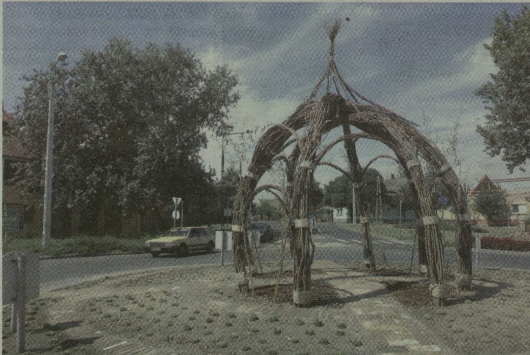
■ EGY-KÉT HÓNAP MÚLVA KIZÖLDELL A FÜZFAVESSZŐKBŐL ÉPÜLT ALKOTÁS