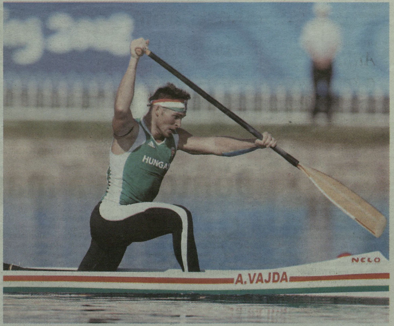
ÍME AZ EZER MÉTER ÚJ OLIMPIAI BAJNOKA, VAJDA TÖKÉLETES HÚZÁSA