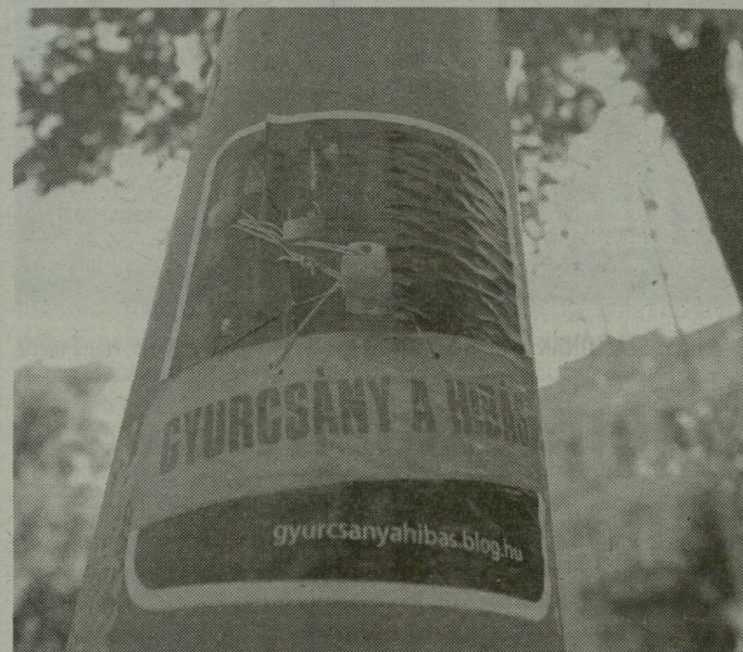
■ SZEGEDEN, AZ ARADI VÉRTANÚK TERÉN IS RAGASZTOTTAK