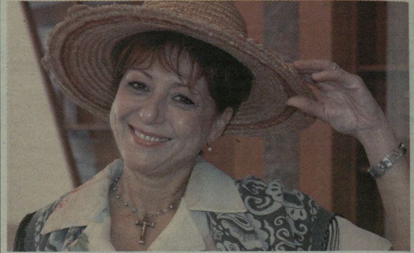
■ FEKETE GIZI LEGKEDVESEBB VERSEIBŐL, SZEREPEIBŐL VÁLOGATOTT