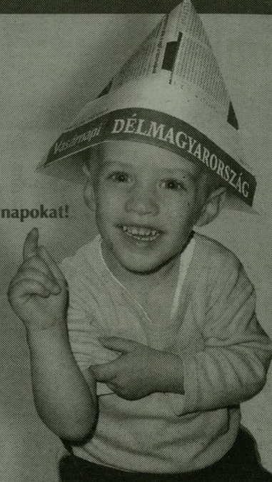
Szép, derős vasárnapokat!