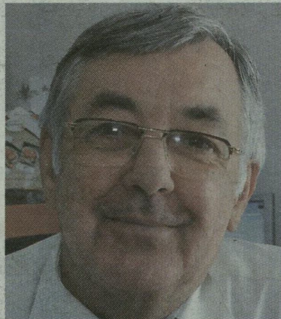
■ MAGYAR EGY BANK VENDÉGEKÉNT UTAZIK