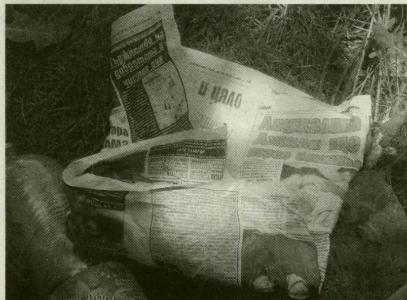
■ ÁRULKODÓ HULLADÉKHALMOK – A KÖZÚTKEZELŐ MUNKÁSAI ITT ÁLIG NÉHÁNY ÓRÁJA GYŰJTŐTÉK ÖSSZE A SZEMETET

és bizony gyakran tapasztalják, hogy sokan – nemzetiségtől függetlenül – szétdobálják a kezük ügyébe eső szemetet. Ők igyekeznek vigyázni, láttuk is: eleve a konténer mellé parkoltak.