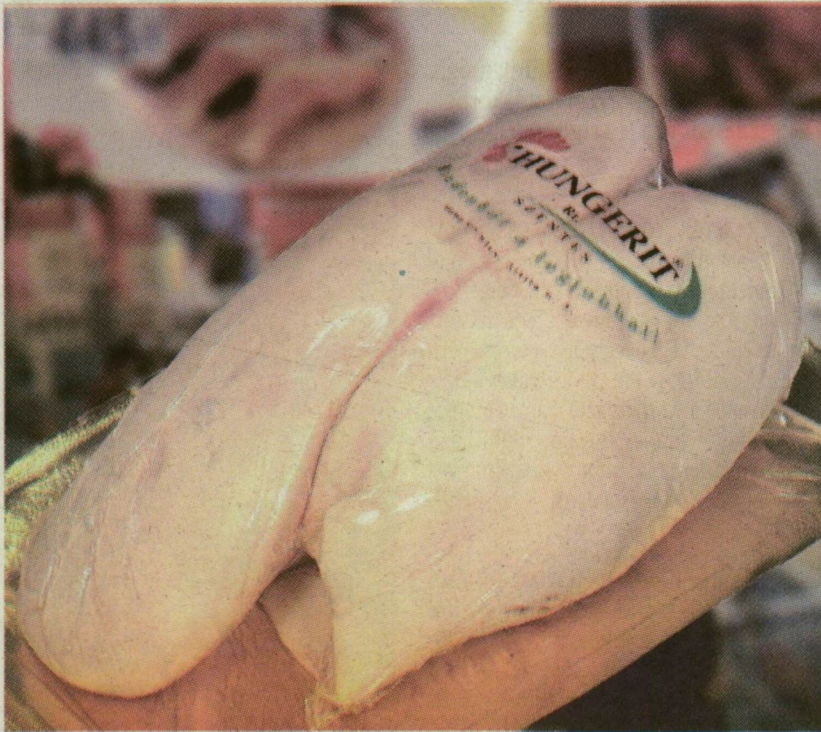
■ A LIBAMÁJ CSEMEGÉBŐL BOTRÁNYKÖVÉ VÁLT