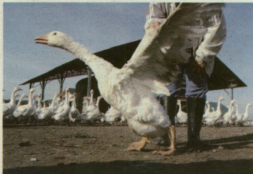
■ A LIBARTARTÓK ÉS A HUNGERITES DOLGOZÓK EGYARÁNT BAJBA KERÜLNEK

A kampánynak olyan hatása lett, amire senki sem számított. A szentesi Hungerit - mint ezt már megírtuk - szeptember 1-jétől leállítja hizottállat-vágását, és 200 dolgozóját küldi