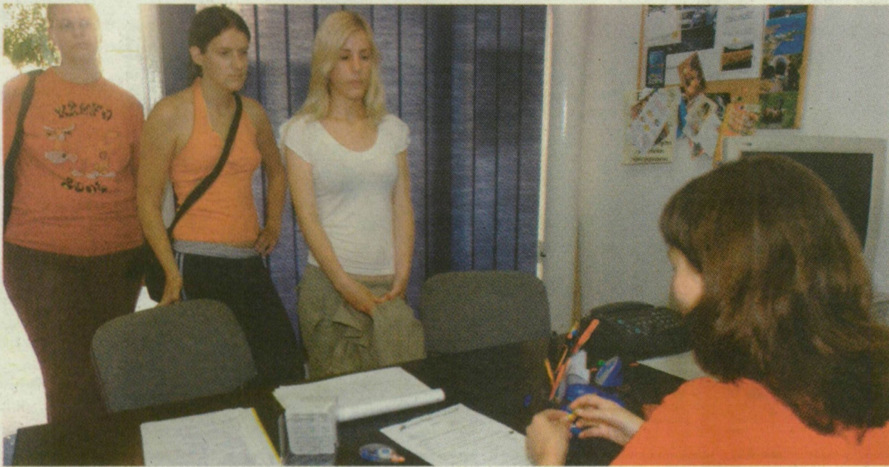
■ MANAPSÁG NAGYON SOK KÖZÉPISKOLÁS ÉS EGYETEMISTA VÁLLAL NYÁRI MUNKÁT