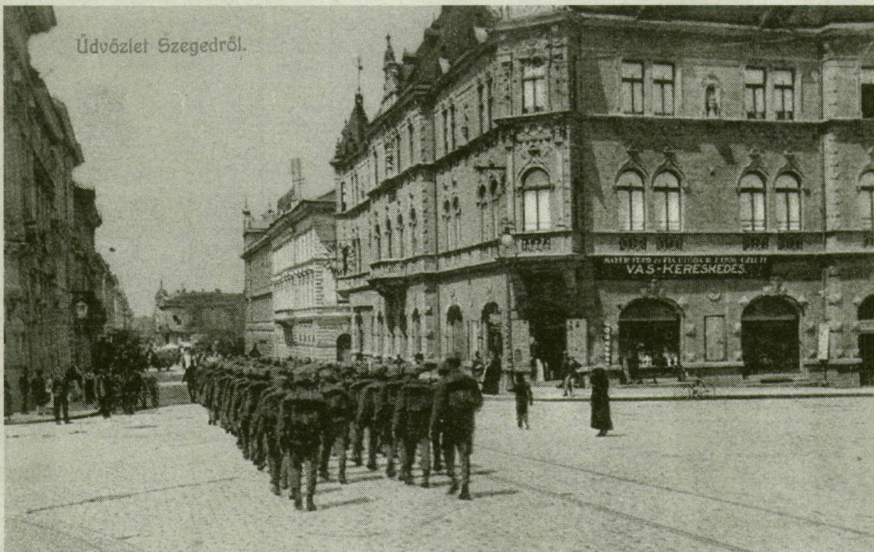
■ Mindennapos látvány a világháború idején: katonák vonulnak Szeged utcáin

Az év közepén valós képet ad Mirkó, egy szegedi hivatalnok az oroszországi hadifoglyok helyzetéről. A cenzúra kikérülésére kieszt, mert 17 pontba szedett levelének páratlan sorait összeolvasva kiderül: „az oroszok igen... rosszul bántanak a hadifoglyokkal. Szibériában vagyok, lakásunkban... dermesztő a hideg és fagyos a világ... Enni és innivalót, valamint dohányt is ... nélkülözünk. Nap-