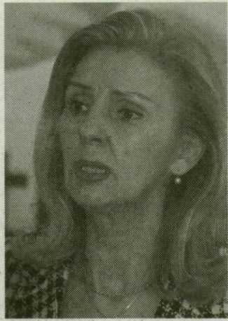
PÁSZTAI ÁGNES, a Centrum Párt elnöke:

- Az már nagyon régen volt, amikor körhintán ültem, még gyerekkoromban, de sosem szerettem igazán. Kicsit veszélyesnek tartom, nem mindig megfelelő a karbantartásuk. Az unokáimat természetesen el szoktam vinni körhintázni, ők nagyon szeretik, még nincs félelemérzetük.