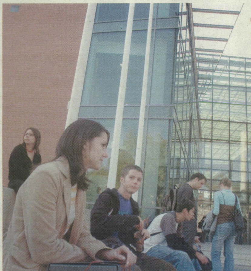
→ ÖSSZE ÚJ HALLGATÓK ÉRKEZNEK SZEGEDRE