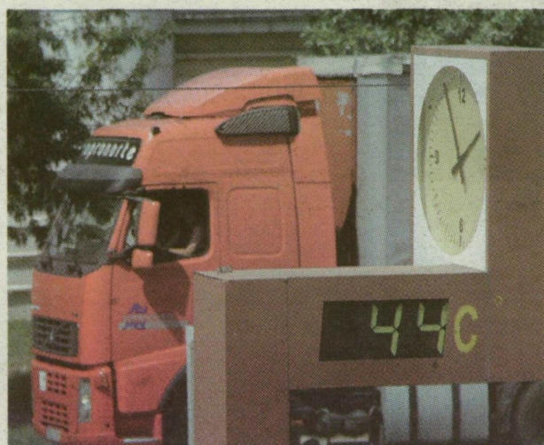
A SAJTÓHÁZ HŐMÉRŐJE TEGNAP DÉLBE ÉS PONTOSAN EGY ESZTENDŐVEL EZELŐTT A TÚZÓ NAPON