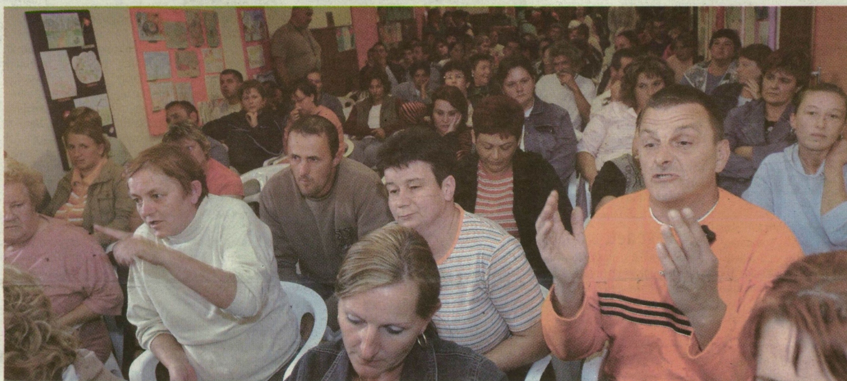
RENDKÍVÜLI SZÜLŐI ÉRTEKEZLETET TARTOTTAK TEGNAP KÜBEKHÁZÁN. FORRTAK AZ INDULATOK