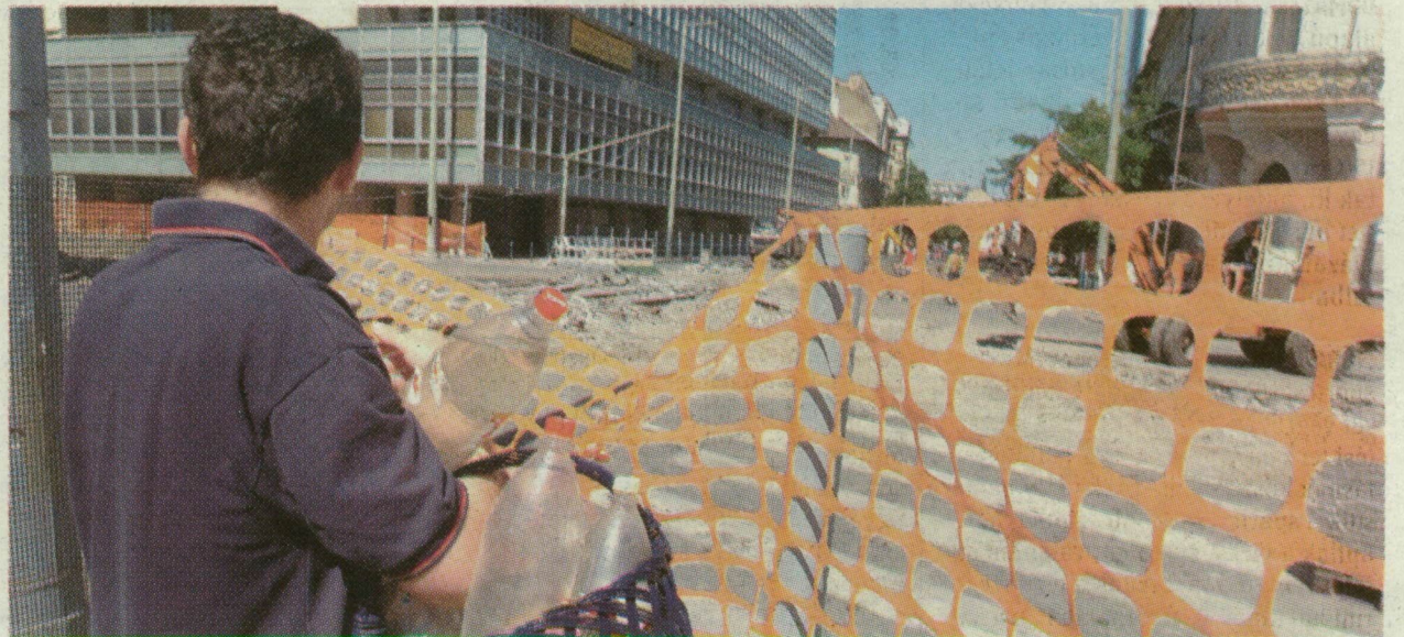
A VÍZ FOGY, VAN, AKI PANASZKODIK, VAN, AKI MEGÉRTŐ