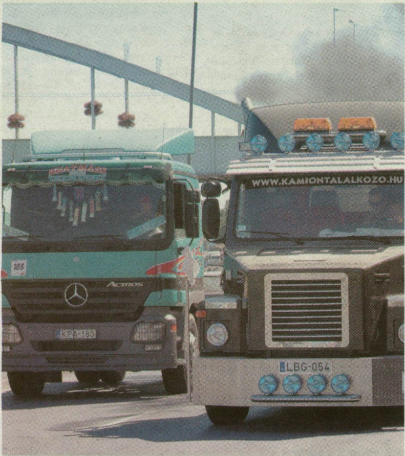
A CSÚCS A GYORSULÁSI VERSENY A RAKPARTON

további FOTÓK a témáról az interneten! www.delmagyar.hu