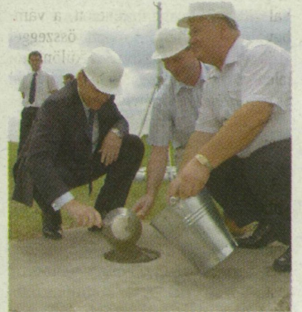
AZ ALAPKÖBEN LAPUNK EGY PÉLDÁNYÁT IS ELHELYEZTÉK