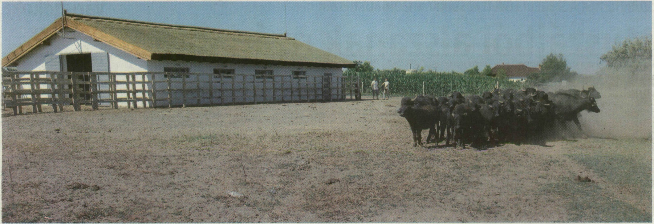
■ AMIKOR KISZABADUL A GULYA: 45 BIVALYTEHÉN ISMERKEDIK ÚJ OTTHONÁVAL