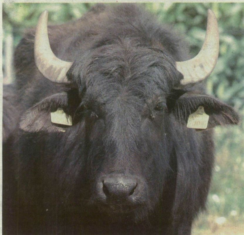
■ NEM KELL SOKÁIG VÁRNI, TAVASSZAL JÖN A BIKAI!

→ MÁRVÁNYFEHÉR BIVALYTEJ. Kato-naviselték nevezik viccesen bivalytejnek a cikóriakávé, látszik, nem ittak még az igazi márványfehér italból. A bivalytehén 10-20 hektót is ad évente, teje hamarabb alszik meg a tehéntejnél, és vitamindúsabb is annál. A belőle készült sajt a mozzarella, a feta és a scheddar. A bivaly húsa rendkívül egészséges, a borjúé pedig olyan porhanyós, mint a tehénborjúé.