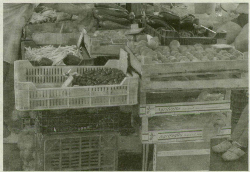
■ A FOSZTOGATÓK AZ ÁRUT KIEMELIK A LÁDÁBÓL, NEM FIZETNEK ÉRTE – PANASZKODOTT TÖBB ÁRUS IS