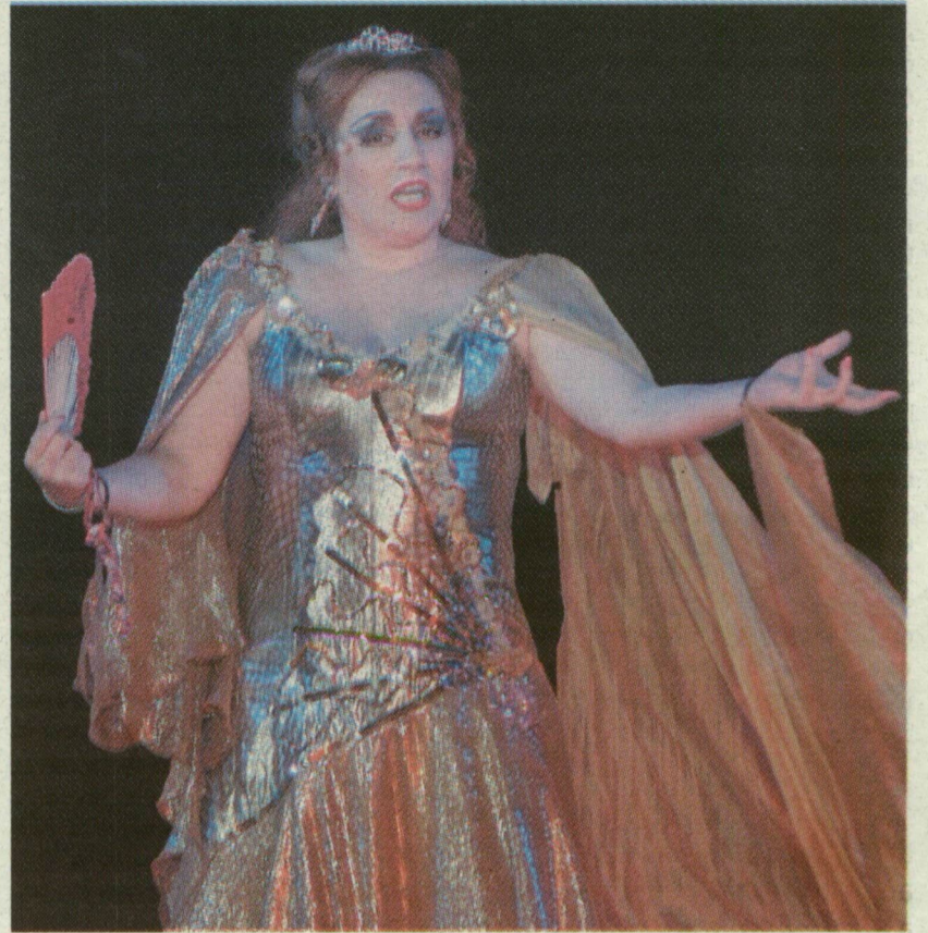
LUKÁCS GYÖNGYI MARICA GRÓFNŐKÉNT A DÓM TÉREN

– A legfontosabb esemény a Kos- suth-díj volt: arra különösen büszke vagyok, hogy nem idősen, betegen, hanem időben, a pályám csúcán kaphattam meg. Még mindig olyan hihetetlen, hogy néha meg szoktam simogatni a kinttétellel kapott szobrocskát. Adós vagyok még a megünneplésével is, hiszen külföl- dön dolgoztam, amikor márciusban a díjtadás volt, nem tudtam haza- jönni, így a lányom vette át a Parla- mentben. Tavaly nyár óta alapvetően megváltozott a magánéletem. Úgy érzem, a pályámra is pozitívan hat, hogy kollégámmal, egy kolozsvári