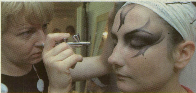
■ BEVÁLT A SMINKELÉSNEK A SZÓRÓPISZTOLY

további FOTÓK a témáról az interneten! www.delmagyar.hu