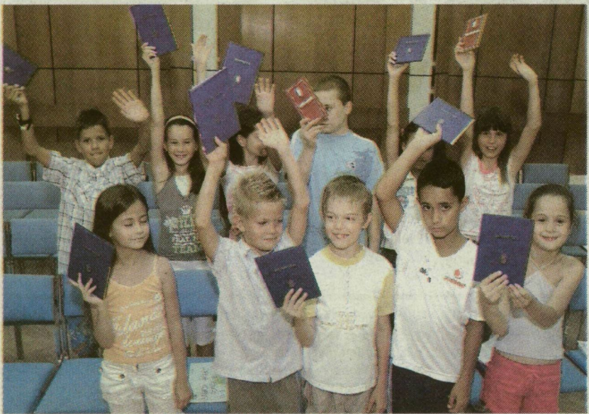
■ A PÓTFOTÓZÁSON SEM VOLT HIÁNY A LELKESEDÉSŐL

Kísérjük figyelemmel a Délmagyarországot és a Délvilágot! → Beszámoló a pótfotózásról a 6. oldalon olvasható