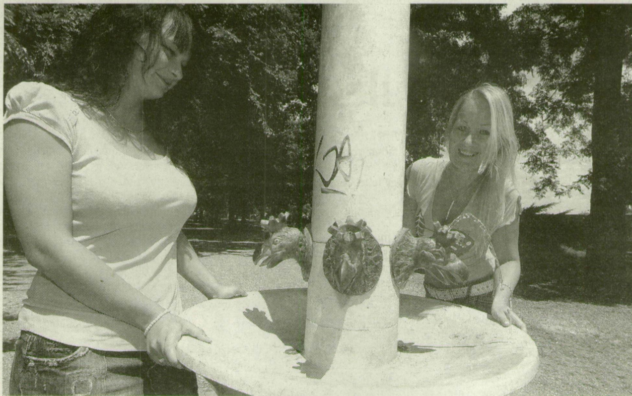
DÍSZKÚT A STEFÁNIAI. JAVÍTÁSA HOSSZADALMASABB, MIVEL EGYEZTETNI KELL AZ ALKOTÓVAL ÉS A RESTAURÁTORRAL