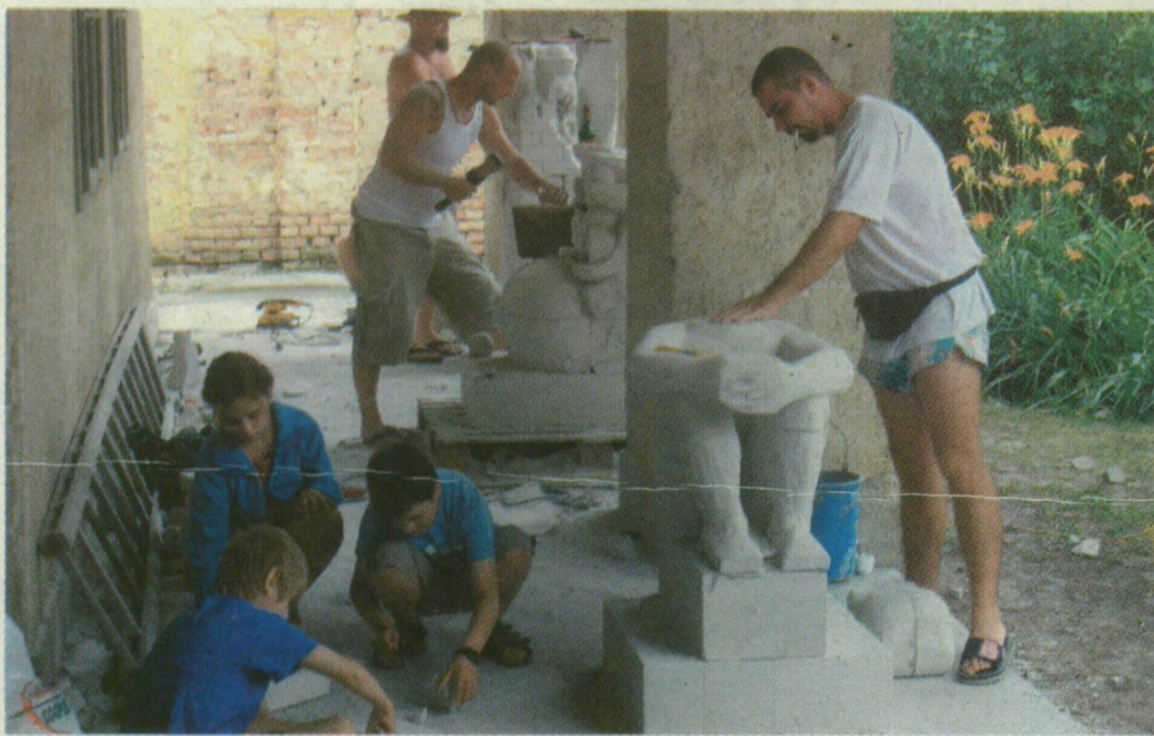
■ FEHÉR YTONG TÉGLÁBÓL FARAGNAK A HELYBELIEK KÜLÖNÖS ALKOTÁSOKAT