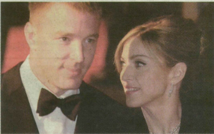
■ GUY RITCHIE ÉS MADONNA: AMIKOR MÉG TELJES VOLT A BOLDOGSÁG