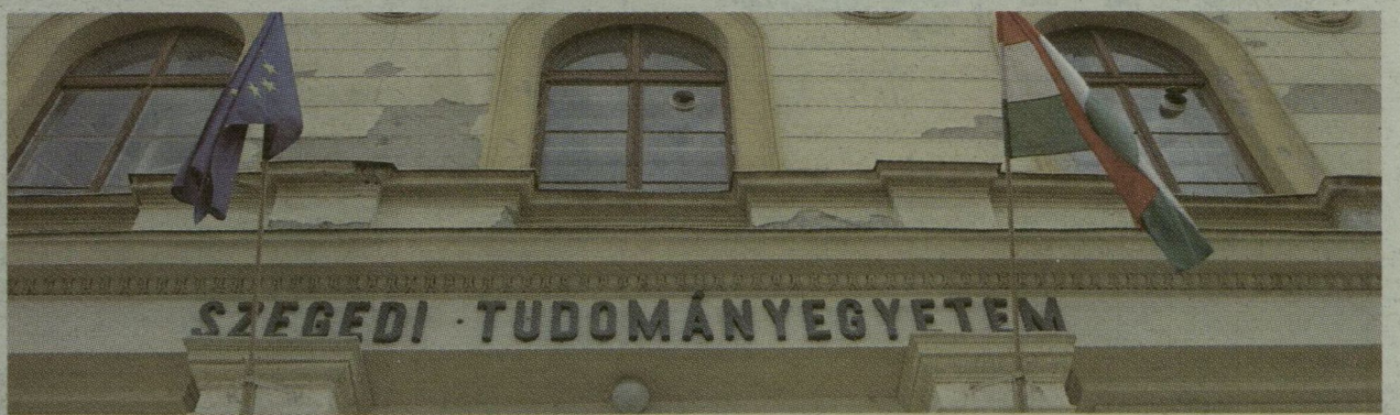
MA KIDERÜL, MARAD-E A KÉPÜNKÖN LÁTHATÓ FELIRAT AZ EGYETEM KÖZPONTI ÉPÜLETÉN