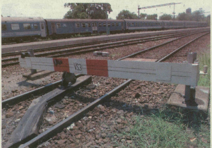
A NAGY SEBESSÉGHEZ ÚJ SÍNEK IS KELLENEK

Azt már más, az interneten keringő elképzelésekből tudjuk, hogy a szupergyors vasútvonal déli irányban Belgrád és Thessaloniki felé folytatódhatna. Jelenleg a Belgrád felé tartó vonatok a Kiskunhalas-Kelebia pályán haladnak. A jövőben azonban a nyomvonal mai Budapest-Szeged pályával párhuzamosan futna, és innen ágazna el Szabadka-Belgrád, illetve Temesvár-Bukarest irányába. Szegeden új vasúti hidat is építeni kellene. Ezek a vonalakon különben 200, de inkább 250 kilométeres óránkénti