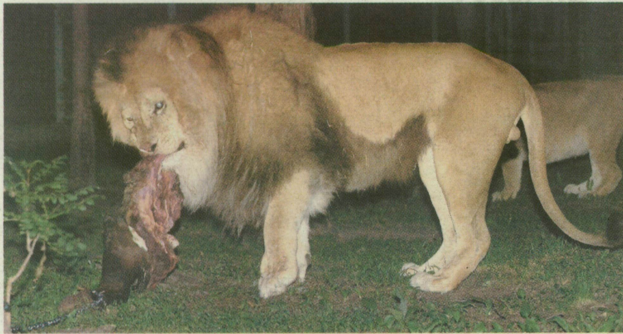
NÉZŐKÖZÖNSÉG ELŐTT FALATOZTAK A NAGYMACSKÁK