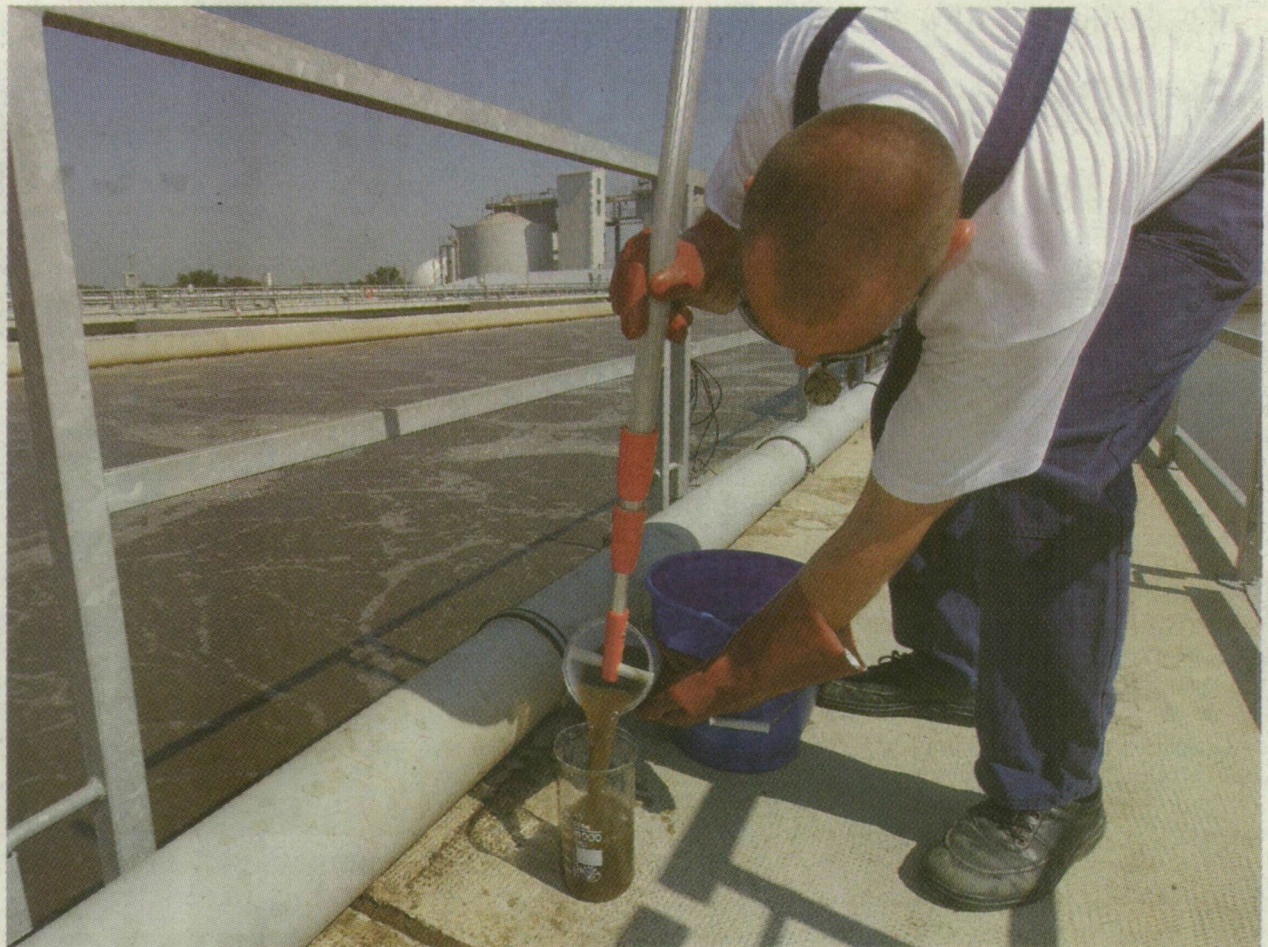
■ MINTAVÉTEL A MEDENCÉBŐL. AZ ÜLEPÍTETT ELEVEN ISZAPOT IS HASZNOSÍTIJÁK

mossák tisztára gigantikus méretű rekeszekben. Ezek akkorák, mintha 16, egyenként 50 méteres és 5 méter