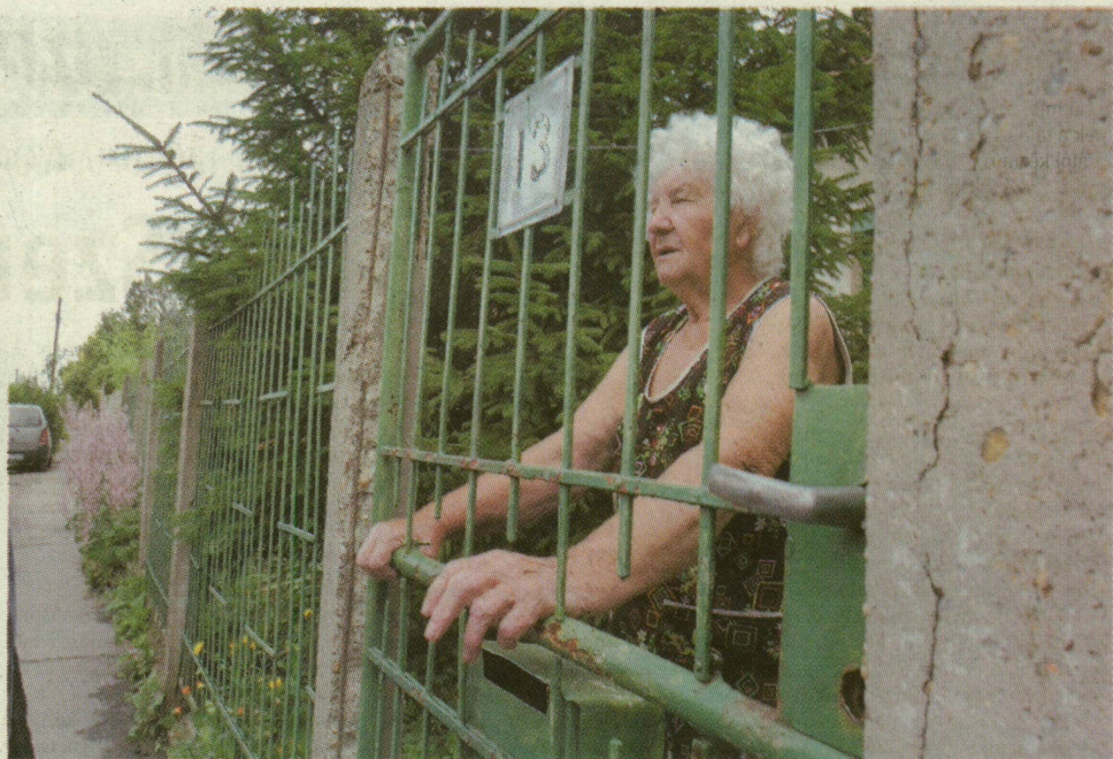
■ AZ ALKOTMÁNY UTCÁBAN MINDENKI JÓL ISMERI A SÉRTETT FÉRFIT ÉS CSALÁDJÁT

KÖRNYEZETTUDATOSSÁG – MAGYAR MÓDRA - Olvasónk Csillag téren készített fotóján a szelektív hulladékgyűjtés újszerű formáját láthatjuk. Ennek menete: miután összeszedjük a PET-palackokat és a fémdobozokat, vigyük el egy szelektív konténerhez – majd öntsük mellé az egészet. Így nemcsak környezettudatosak leszünk, de mintát adhatunk a többi szemetalónek is. Fekete pont a gyűjtőket ritkán ürítő Szegedi Környezetgazdálkodási Kft.-nek, és annak is, aki képtelen volt a megtelt gyűjtőtől két percre lévő másikig elvinni a hulladékát.