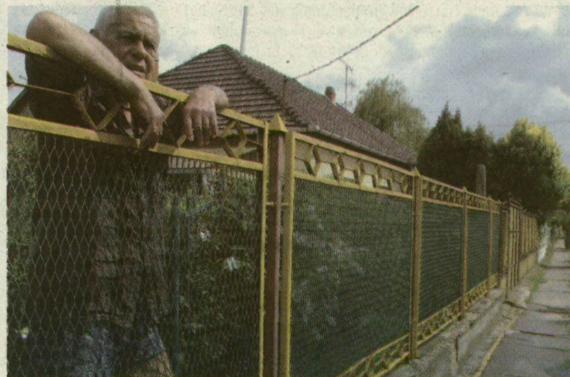
■ A SZOMSZÉDOK BESZÉLNEK, DE NEVÜKET NEM ADJÁK